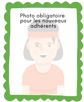
Photo obligatoire pour les nouveaux adhérents